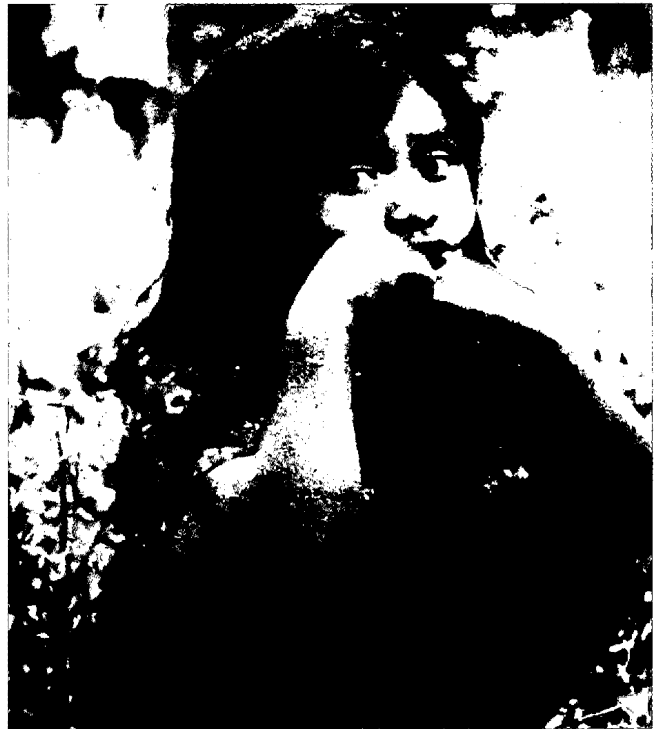
El problema de la prostitución es ingente y no sólo aqueja a la niñez, en países en desarrollo alcanza también a amas de casa.

El artículo 194 del Código Sustantivo impone una sanción de diez a 25 años al que produzca, transporte,