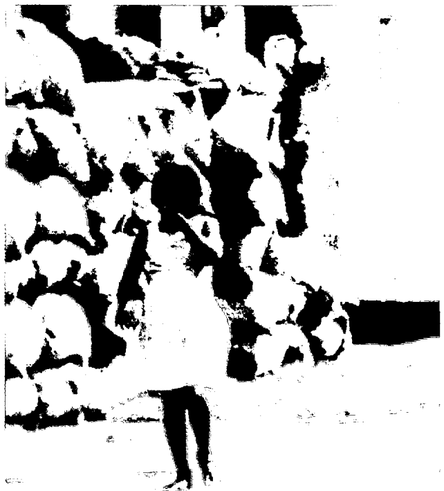
Cuando la zanja entre desarrollo y subdesarrollo se abisma, en esa medida el tráfico y el abandono infantil crece.

"...consiste en ubicar al sujeto pasivo, esto es, un menor de edad en situación de desamparo, lo cual implica la privación momentánea o definitiva de los cuidados que le son necesarios y que conforme a derecho le son debidos en la salvaguarda de su integridad". 10